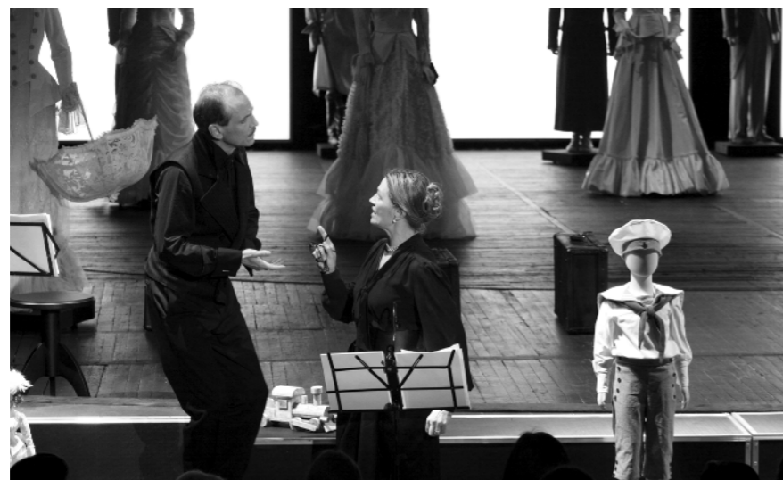
Спектакль «Каренин», Кировский театр юного зрителя «Театр на Спасской»