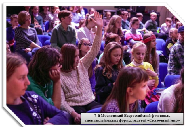
7-й Московский Всероссийский фестиваль спектаклей малых форм для детей «Сказочный мир»

➤ Фестиваль-конкурс творческих работ педагогов Екатеринбурга, Кургана, Челябинска, Тюмени, Ямало-ненецкого и Ханты-Мансийского АО «Весь мир – театр» – привлечение внимания педагогической общественности к вопросам использования театральной педагогики в профессиональной деятельности учителя, формирование творческой образовательной среды современного педагога.